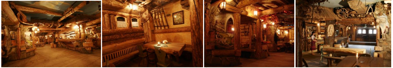
Fot. Karczma góralska.

Wchodząc do karczmy odczuwamy niepowtarzalny klimat, który tworzy go z pewnością wystrój. Karczma urządzona jest w stylu regionalnym. Już przy wejściu musimy przekroczyć wysoki próg jakże charakterystyczny dla chat góralskich. Dołożmy do tego liczne sprzęty gospodarstwa domowego rozmieszczone na tle przepięknych malowideł ściennych wykonanych przez ludowego artystę. Miło drażni zapach dymu jałowca unoszącego się z kamiennego paleniska, stojącego po środku jednej z izb. Każdy czuje się tutaj dobrze, nawet koty, które dumnie przechadzają się między gośćmi. Na prawdziwych kamieniach młyńskich, pod strzechą umiejscowiony jest bar, w którym można dostać nie tylko "żytnióweczkę".