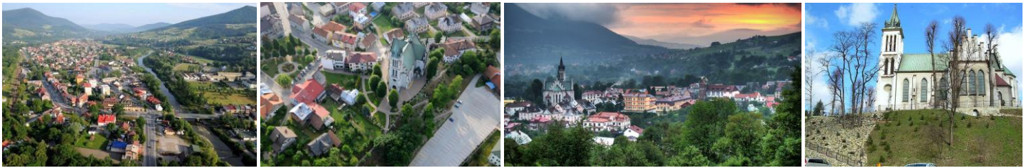
Fot. Mszana Dolna.

Pierwszy dokument wzmiankujący Mszaną Dolną pochodzi z 1365. Jej lokacja w poł. XIV w. była zasługą Kazimierza Wielkiego. Prawa miejskie otrzymała jako Kinsbark (Königsberg) pod koniec panowania tego władcy lub pod koniec XIV w. decyzją Władysława Jagiełły. Jednak już w XV w. osada utraciła prawa miejskie, a pozostałość po mieście Kinsbark, zwana Mieściskiem, została w 1464 włączona do istniejącej równolegle starej wsi Mszany. Podczas potopu szwedzkiego miasto zostało doszczętnie zburzone. Istnieją też źródła z 1254 roku mówiące o rzece Mszanka figurującej pod nazwą Mschena.