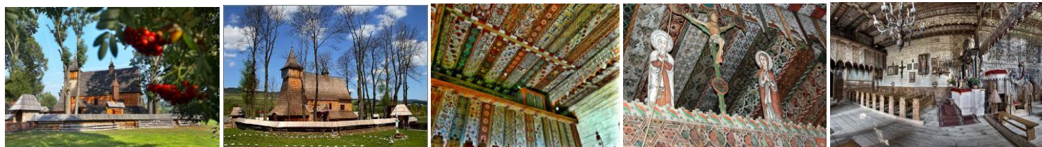
Fot. Kościół w Dębnie Podhalańskim.

Kościół św. Michała Archanioła to gotycki, drewniany kościół parafialny wpisany na listę światowego dziedzictwa UNESCO . Pierwszy kościół w Dębnie wzniesiono prawdopodobnie w XIII wieku. Obecny kościół wybudowany został w II połowie XV w na miejscu starszej świątyni. Z tego okresu pochodzą nawa i prezbiterium. Jest to świątynia orientowana o konstrukcji zrębowej. Jest jednym z najlepiej zachowanych gotyckich drewnianych kościołów i jednocześnie jednym z najbardziej znanych polskich zabytków w kraju i zagranicą (otrzymał jako jedyny drewniany kościół nominację w konkursie siedmiu cudów Polski), wyróżnia się sylwetką (praktycznie niezmienioną od czasów budowy) – wkomponowaną w krajobraz i wyjątkowo cennym ruchomym wyposażeniem, a także unikatową polichromią patronową pochodząca z około 1500 roku, najstarszą, w całości zachowaną w Europie, wykonaną na drewnie. Niewątpliwie jest to najlepiej zachowana tego rodzaju polichromia w Polsce . Jest wykonana w 33 kolorach i zawiera aż 77 motywów w 12 układach. Najczęstsze to ornamenty roślinne i geometryczne. Występują także wątki figuralne i zwierzęta, wśród nich głównie jelenie. Szablony były wielokrotnie używane w różnych obiektach, te prawdopodobnie, ze względu na ich świecki charakter w dworach szlacheckich i magnackich.